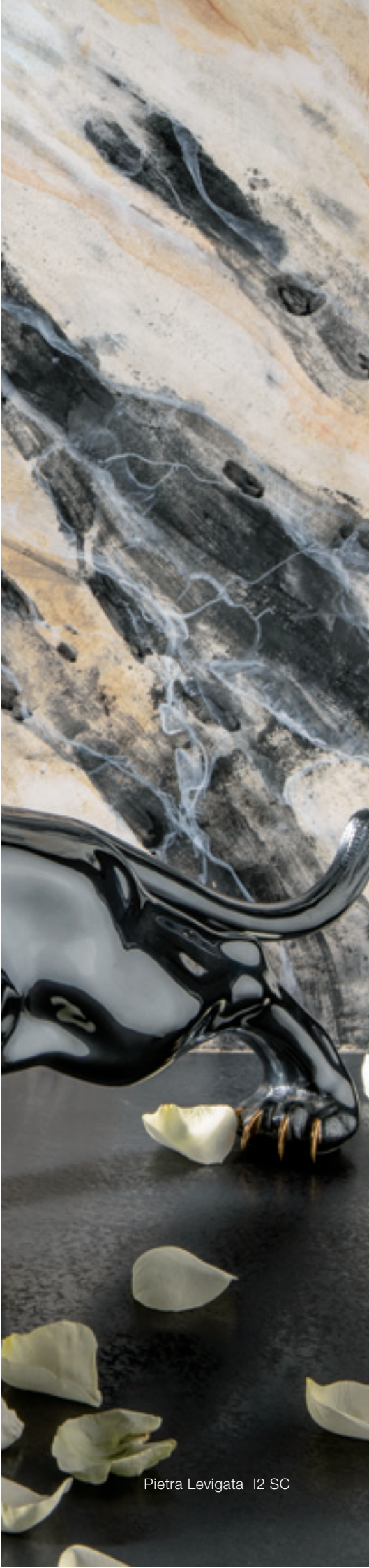
Pietra Levigata I2 SC

Colori fotografici ed indicativi - Photographische und himweisende Farben - Cores fotograficos y sugerencias - Călori fotografice și sugerate - Φωτογραφικά και προτεινόμενα χρώματα.