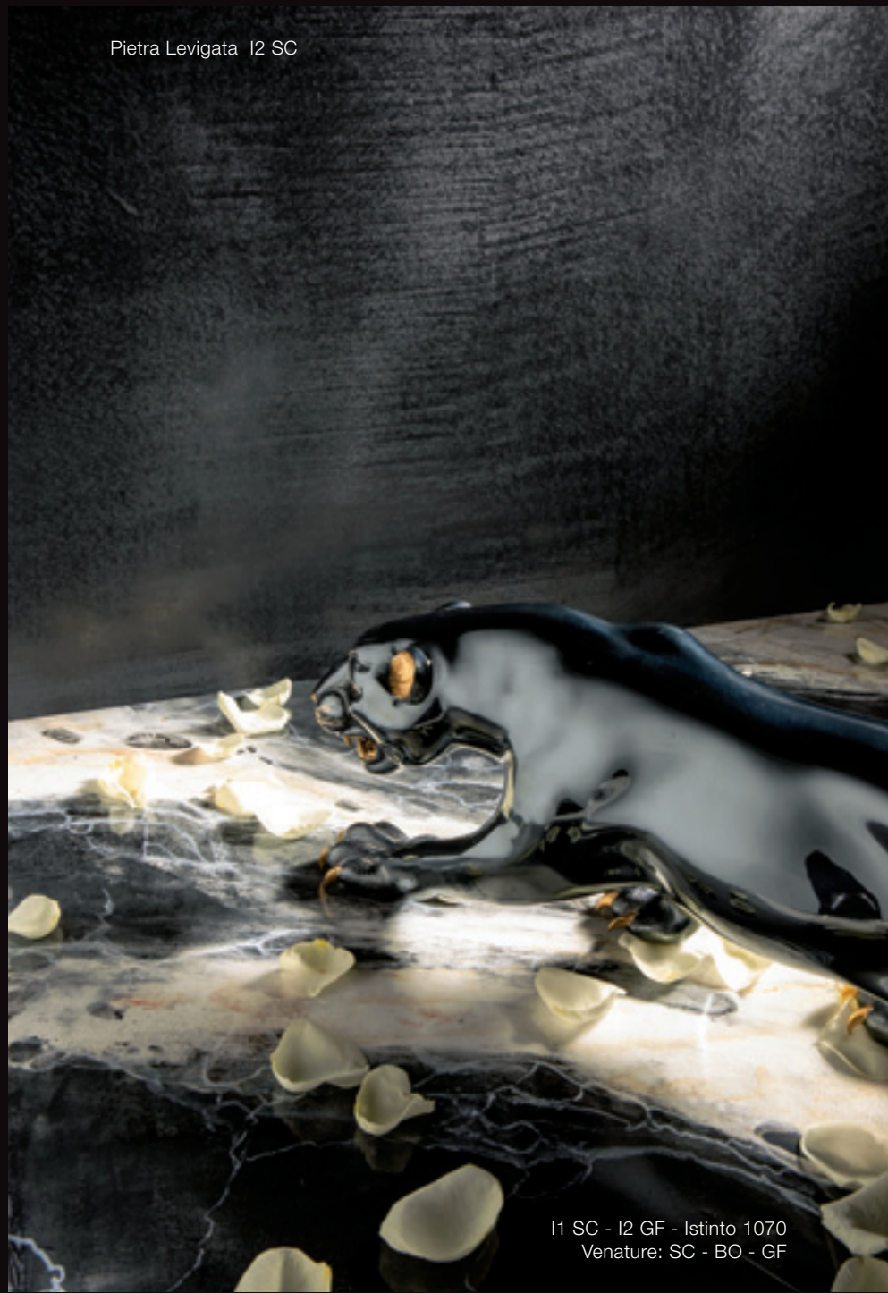
Pietra Levigata I2 SC

Colori fotografici ed indicativi - Photographische und himweisende Farben - Cores fotograficos y sugerencias - Călori fotografice și sugerate - Φωτογραφικά και προτεινόμενα χρώματα.